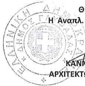
ΚΑΝΝΑ ΚΥΡΙΑΚΗ ΑΡΧΙΤΕΚΤΩΝ ΜΗΧΑΝΙΚΟΣ