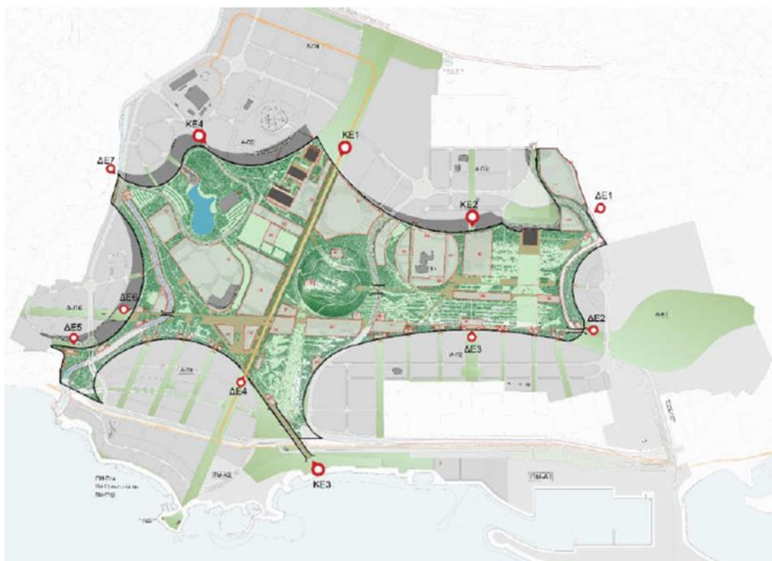
εικόνα 46: Συνδέσεις του ΜΠ με την ευρύτερη περιοχή