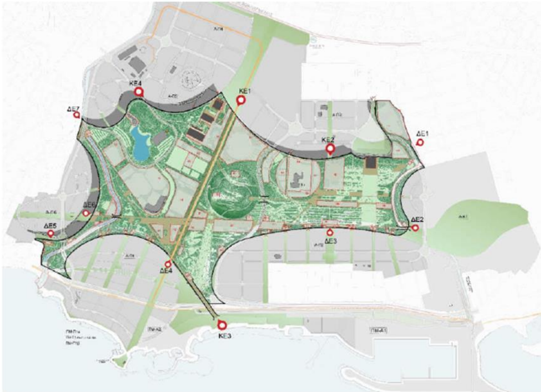
εικόνα 46: Συνδέσεις του ΜΠ με την ευρύτερη περιοχή

• Δευτερεύουσα είσοδος ΔΕ1. Η χωροθέτηση της εισόδου αυτής προς το Πάρκο διασυνδέει ικανοποιητικά το Δήμο Γλυφάδας με το χώρο πρασίνου και αναψυχής του Πάρκου και παρέχει πρόσβαση στο δίκτυο ποδηλατοδρόμων και πεζοδρόμων εντός του Πάρκου. Ωστόσο, όπως είχαμε διατυπώσει σε προηγούμενο κείμενο παρατηρήσεών μας, θεωρούμε αναγκαία και χρήσιμη και για τις δυο πλευρές την επέκταση του δικτύου ποδηλατοδρόμων και πεζοδρόμων προς τον Δήμο Γλυφάδας, με σκοπό τη διασύνδεση του Πάρκου με την ευρύτερη περιοχή του Δήμου και με τον Υμηττό. Είμαστε πρόθυμοι να συζητήσουμε σχετικά με τον τρόπο χρηματοδότησης της επέκτασης του δικτύου ποδηλατοδρόμων-πεζοδρόμων, τόσο αυτόνομα όσο και σε συνάφεια με τις εισφορές σε γη ή χρήμα οι οποίες θα προκύψουν από τη πολεοδόμηση των περιοχών ανάπτυξης που εμπίπτουν στα όρια του Δήμου μας.